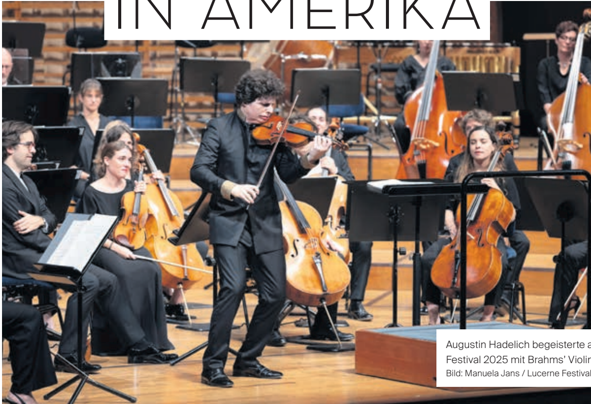
Augustin Hadelich begeistert am Lucerne Festival 2025 mit Brahms' Violinkonzert.

Augustin Hadelich zeigt als «artiste étoile» seine grosse Bandbreite. Aus seiner Wahlheimat Amerika bringt er Spätromantik und eine «Fiddle Night» mit und erfüllt sich mit den Berliner Philharmonikern einen Jugendtraum.