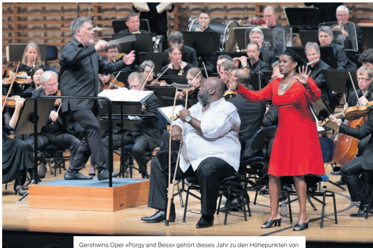
Gershwins Oper «Porgy and Bess» gehört dieses Jahr zu den Höhepunkten von Lucerne Festival. Die Aufnahme entstand 2022.

Ein einsamer Klarinettenon, ein kühnes Glissando – und der Mut zur stilistischen Grenzüberschreitung: George Gershwin schuf aus Jazz und Klassik eine neue Musik und nebenbei das berühmteste Stück der Welt.