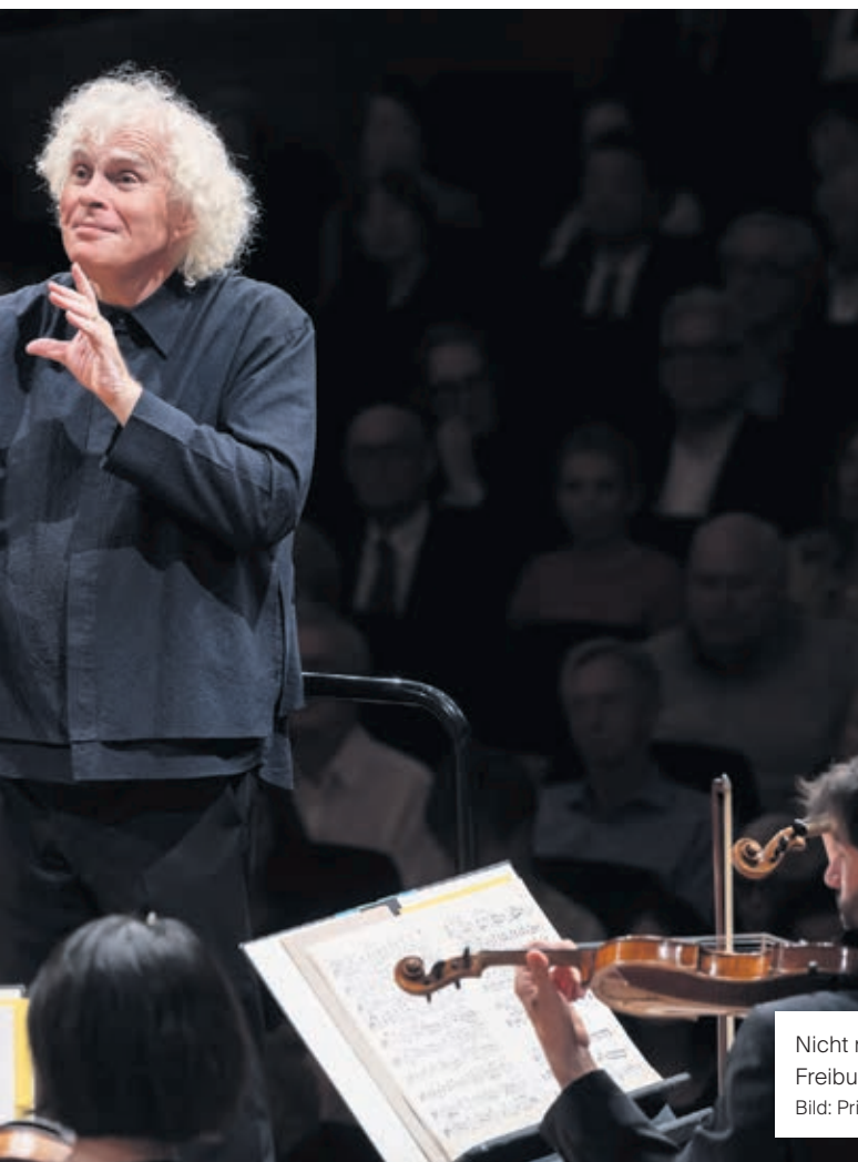
Nicht mit seinem Stammorchester, sondern mit dem Freiburger Barockorchester in Luzern: Sir Simon Rattle.