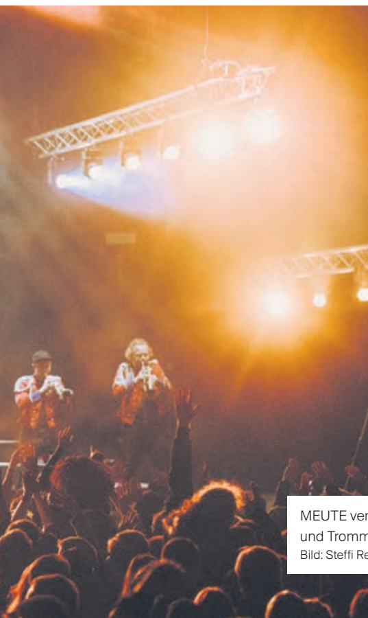
MEUTE verwandelt den Luzerner Saal mit Bläsern und Trommeln in einen pulsierenden Dancefloor.

Ein Minimal-Music-Höhepunkt ist das Konzert des LFCO unter der Dirigentin Elim Chan. Hier erklingt ein sinfonisches Kondensat von John Adams' Oper «Doctor Atomic», die an die ersten US-amerikanischen Atombombentests in der Wüste New Mexicos erinnert (29.8.). Terry Riley ist vertreten mit seiner legendären Komposition «In C», die als «Urknall der Minimal Music» gilt: Sie revolutionierte in den 1960ern den Konzertbetrieb mit repetitiven Mustern (7.9.). Bei «In den Strassen: City Stage» füllt La Monte Youngs «Trio for Strings» mit schier endlos ausgehaltenen Tönen das «American Dream House» (25. und 26.8.). (hü)