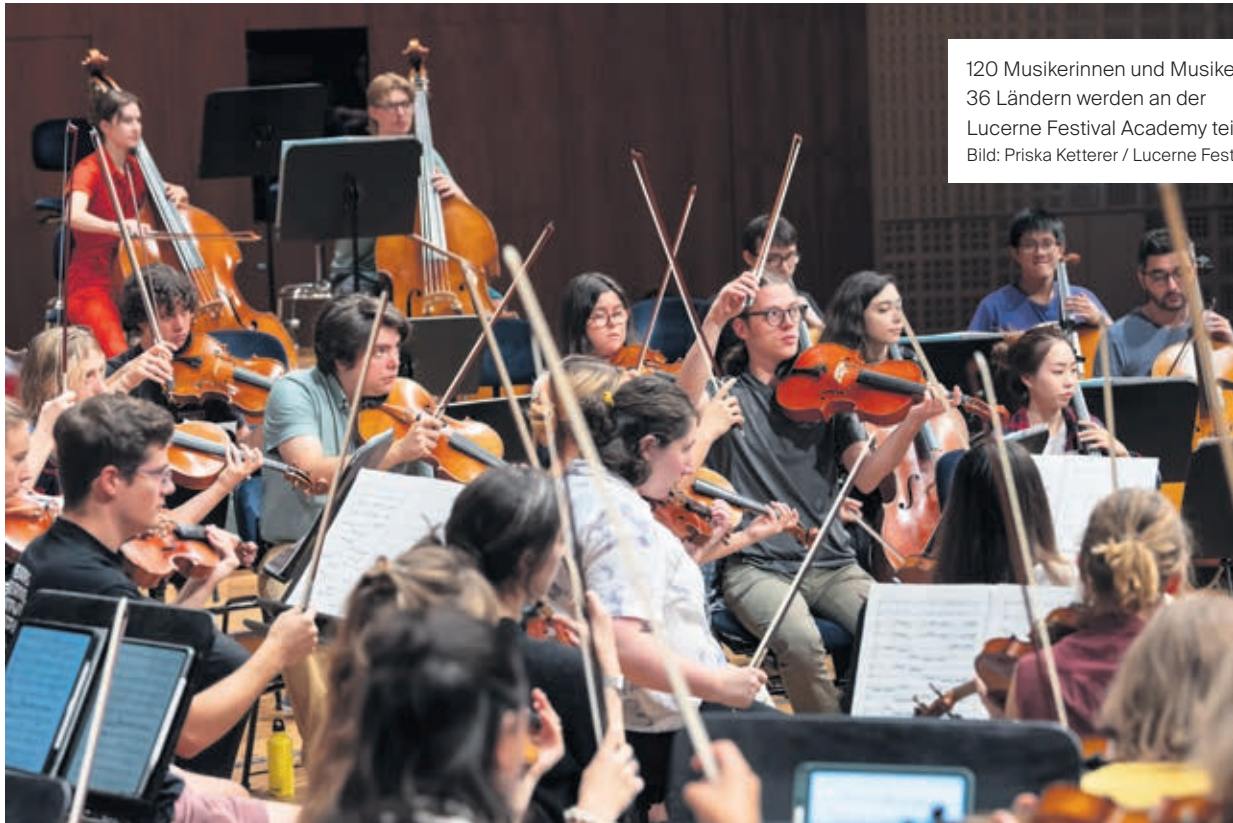
120 Musikerinnen und Musiker aus 36 Ländern werden an der Lucerne Festival Academy teilnehmen.