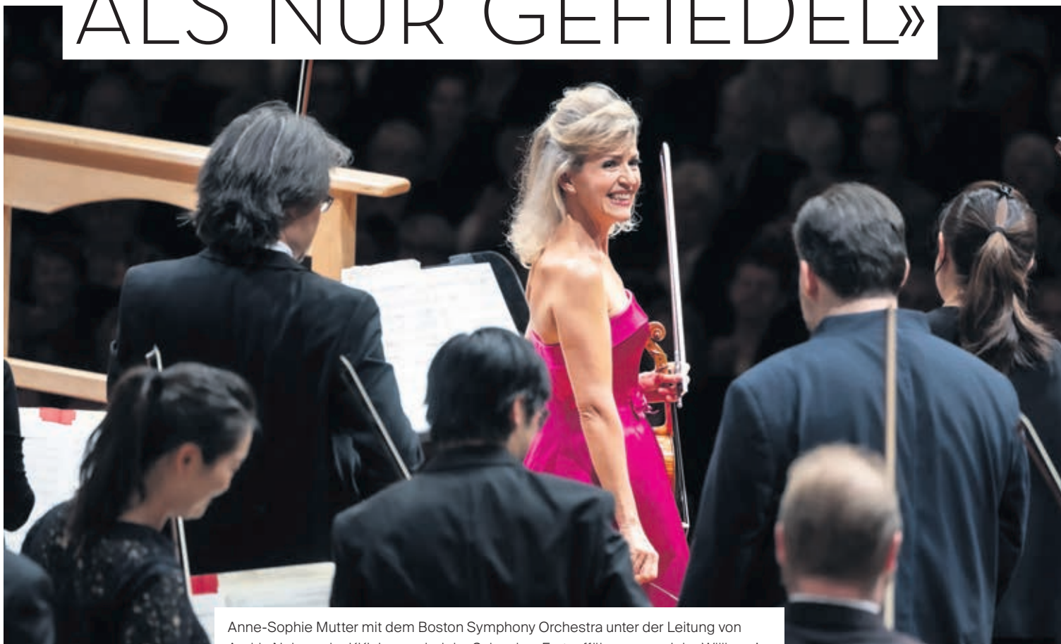
Anne-Sophie Mutter mit dem Boston Symphony Orchestra unter der Leitung von Andris Nelsons im KKL Luzern bei der Schweizer Erstaufführung von John Williams' Violinkonzert Nr. 2 am Lucerne Festival 2023.

Vor fünfzig Jahren begann Anne-Sophie Mutters Karriere in Luzern. Bei Lucerne Festival zeigt die Weltklassegeigerin ihre grosse stilistische Bandbreite. Ein Gespräch über das lebensentscheidende Vorspiel bei Herbert von Karajan, hochemotionale Werke und ihre tiefe Verbindung zu Amerika.