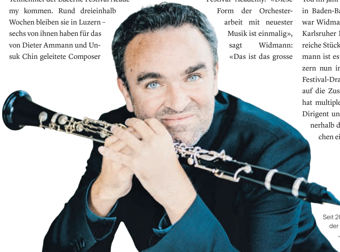
Seit 2026 Künstlerischer Leiter der Lucerne Festival Academy: Jörg Widmann.