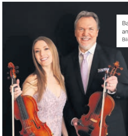
Bald zu dritt: wenn das Paar zur «Fiddle Night» am 5. September auf Augustin Hadelich trifft.

Die Geige sei das wichtigste Bluegrass-Instrument: «Deshalb fiel es mir leicht, mich in diesem Stil zu Hause zu fühlen», sagt Hadelich. Man wird es sehen, wenn er mit dem Ehepaar O'Connor gemeinsam auftritt. Alle drei mit der Violine, versteht sich, wobei Mark O'Connor zudem Gitarre und Mandoline spielt.