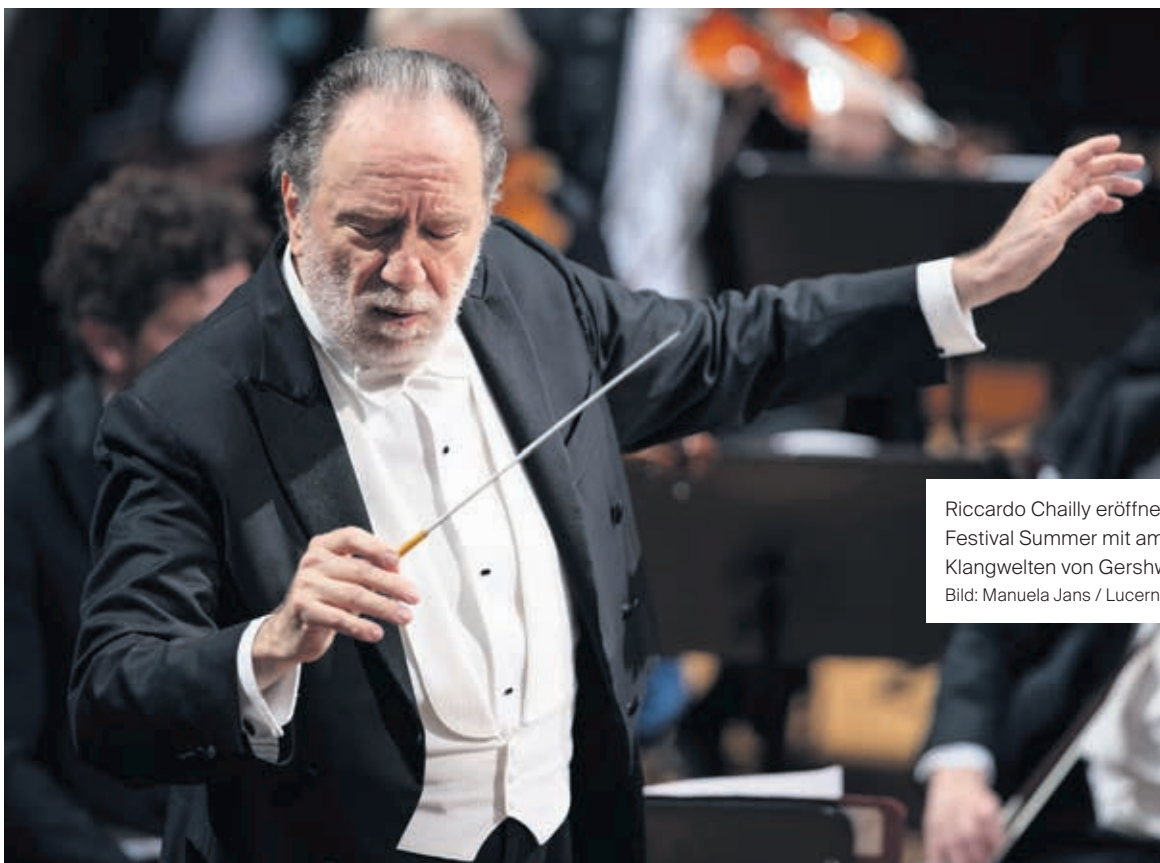
Riccardo Chailly eröffnet Lucerne Festival Summer mit amerikanischen Klangwelten von Gershwin bis Ives.