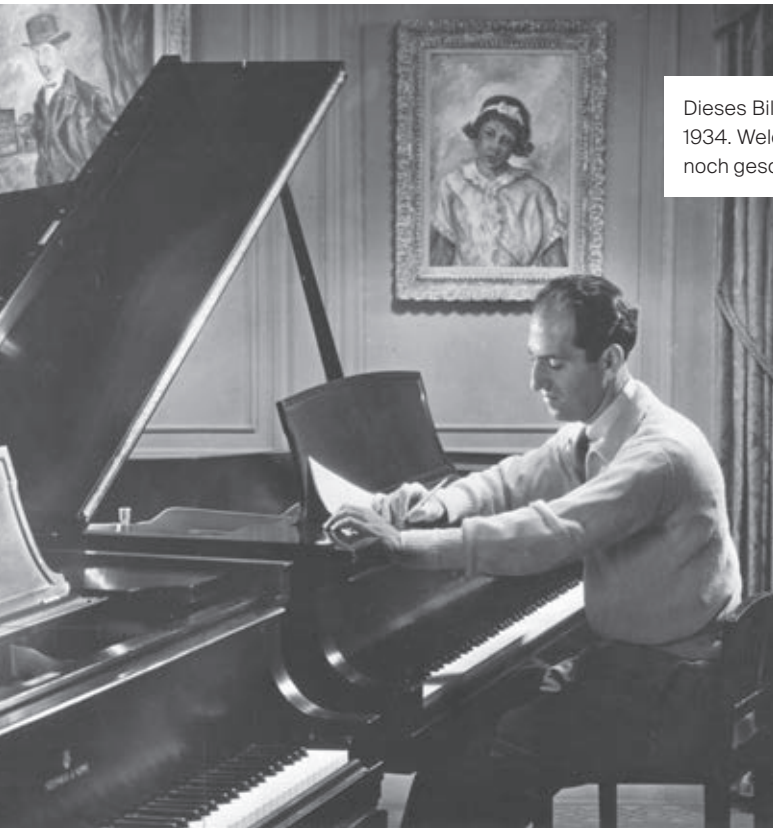
Dieses Bild George Gershwins entstand im Januar 1934. Welche Werke der früh verstorbene Musiker noch geschaffen hätte, bleibt offen.

Schon die Entstehung war aussergewöhnlich: Mit seinem Bruder Ira und dem Texter Buddy DeSylva verbrachte Gershwin einen vergnüglichen Abend im The Ambassador Billiard Parlor am Broadway. Zwischen zwei Runden Billard entdeckte Ira in einer Zeitung die Ankündigung eines Konzertes. Am 12. Februar sollte es stattfinden, zu Ehren von Abraham Lincolns Geburtstag und als Feier der «neuen amerikanischen Musik». Extra für diesen Abend sei «George Gershwin an der Arbeit für ein Jazz-Konzert».